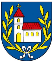
Príloha 2: vlajka obce